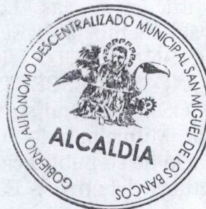
Abg. Marco Calle Ávila ALCALDE DEL CANTON SAN MIGUEL DE LOS BANCOS