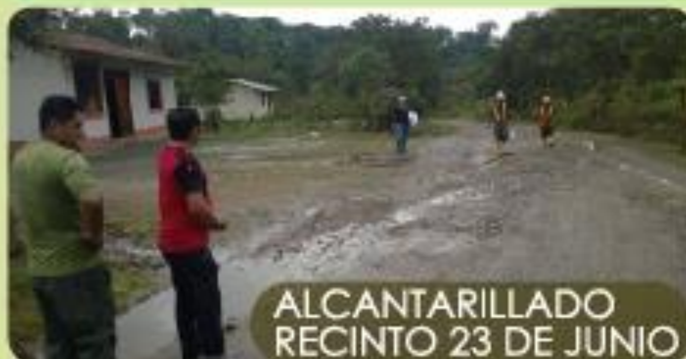
ALCANTARILLADO RECINTO 23 DE JUNIO

Se inicio la construcción del Alcantarillado Sanitario del Recinto 23 de Junio, proyecto retomado con inversión de $ 97.000,00; Cuya dotación ayudará a conservar los ríos, el tratamiento de las aguas negras se realizará en planta de tratamiento. Esta inversión responde a las obras priorizadas por la comunidad de este sector.