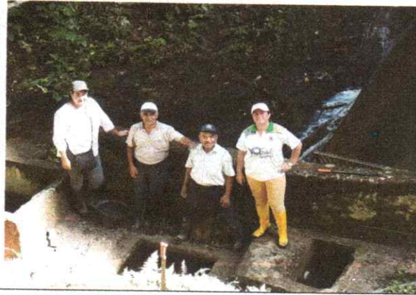
Captación de Posa Onda. 20 mayo 2019