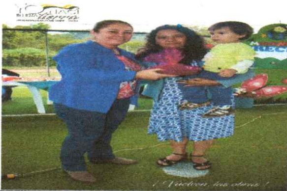
Proyectos sociales, Mindo. 22 mayo 2019