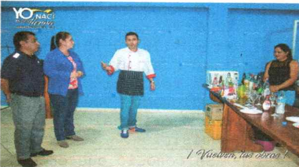
Curso de coctelería. Mindo. 22 mayo 2019